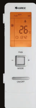
YAG1FB Amber Amber Royal Silver X Champagne X